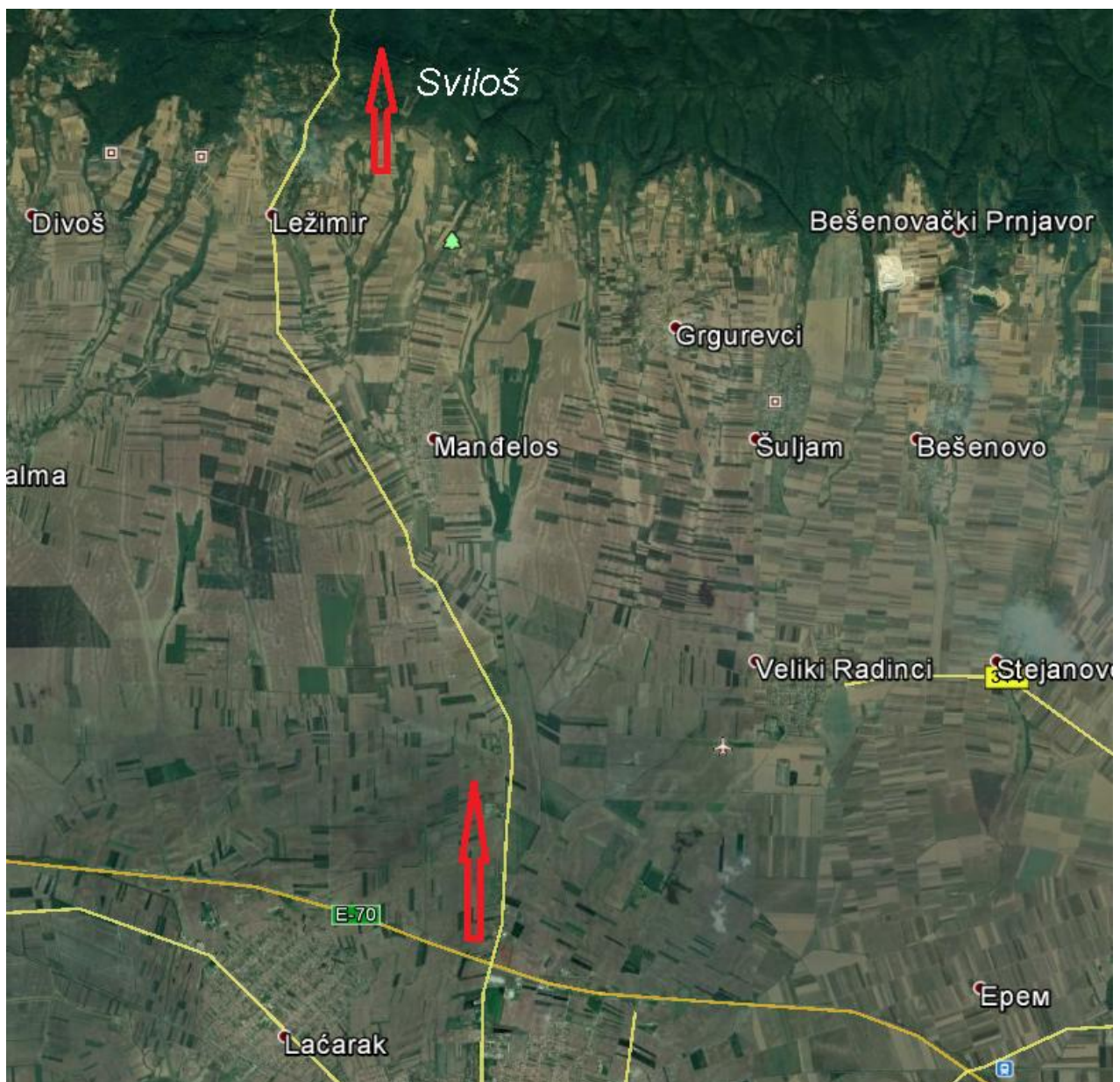
Карта пута од Е70 до Лежимира